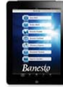
iPad Wi-Fi + 3G 16 Gb