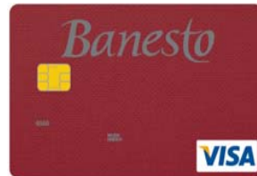
Diez en Una