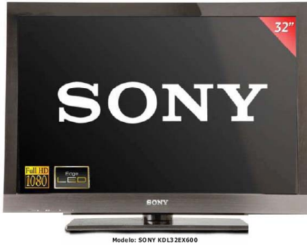
TV 32" (81cm), TDT Full HD 1080, Edge LED, marco estrecho y conexiones multimedia

Portátil Compaq de HP, Procesador Intel® Celeron Dual Core T3500, Memoria 2GB, disco duro 250 GB, DVD grabador, Intel Graphics Media Accelerator 4500MHD, Windows 7 Premium